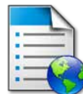
Forms and Favorites